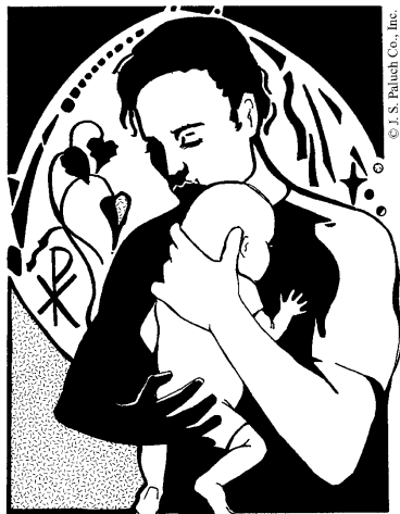
Happy Father's Day